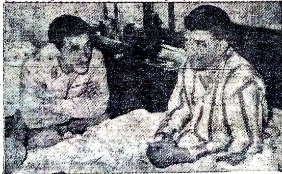
Presiden Naguib yang berpakaian pijama, dalam raman sakit di Alexandria, kini tampak berbitjara dengan dand, major Amir Abdul-Hakim, panglima besar dari angkatan Perang Mesir.

PSII yang mendapat suara terbanyak dipilih sebagai wakil ketua. Dan setelah diperkenalkan kepada sidang wakil2 partai yang telah terpilih itu rapat djutup pada djam 1 tengah malam.