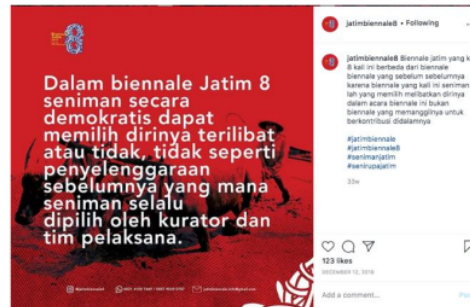
Figure 2. Infografis dan caption posting feed Instagram @biennalejatim8 pada Biennale Jatim 8 - 2019

seni dan media komunikasi publikasi Instagram tersebut. Tema “GAS TOK! Lebur Sakjeroning Jawa Timur”, menunjukkan memposisikan gelaran Biennale Jatim adalah milik dan melebur bersama masyarakat Jawa Timur. Pagelaran karya seni dalam format Biennale yaitu sebagai sebuah perayaan dan imajinasi bersama yang bersifat inklusif, tidak ada sekat dan tanpa lokasi pameran utama ( crown venue ) yang selama ini menjadi stigma dan keharusan dalam proses pagelaran Biennale Jatim.