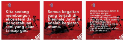
Figure 1. Visual Grafis Posting Feed Instagram @biennalejatim8