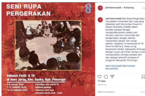
Figure 3. Infografis dan caption posting feed Instagram tentang pergerakan seni rupa

2 Menurut Castells (2011), masyarakat informasi memiliki beberapa sudut pandang terhadap perkembangan masyarakat informasi, yaitu ada enam hal yang menggambarkan masyarakat informasi dari sudut pandang Manuel Castells, yaitu informasi 2 ne, masyarakat berjejaring, ekonomi global atau ekonomi informasi, transformasi tenaga kerja, kota global dan budaya siber (Castells, 2011b). Berikut ini metadata discourse yang diambil dari akun Instagram @biennalejatim dan @biennalejatim 8 sebagai obyek penelitian analisa wacana digital (digital discourse analysis) dalam penelitian ini.