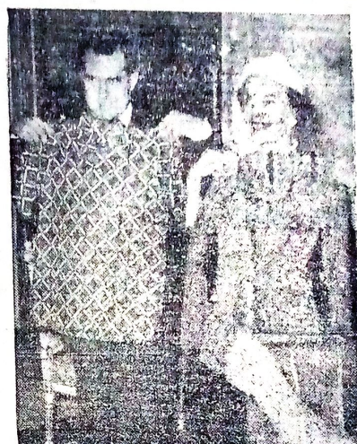
Setelah tiba di Istana Negara, vice presiden Amerika Nixon dan njonja menerima tanda mata berupa kemedja batik dan sarong kabaja Indonesia. G a m b a r: Njonja dan tuu Nixon dgn. tanda-matanja yang baru.

ruah2 tanah untuk mengisi ketu ranganja. Pengharapan para petani musim hujan ini tidak terlalu baik. Sehingga perhitungan persediaan bahan makanan bisa sampai pada musim panen yang akan datang. Makanan utama bagi penduduk Malang Selatan daerah minus itu, ialah djaugung dan gaplek. Maka dari bulan telah dianjurkan kebutuhan persediaan di kabupaten2 mg. mojo jad. Di tiap2 ketjamatan jg. telah ditentukan, sudah mem punjai persediaan lk. 100 ton djaugung gaplek dalam „lumbung patjeklik“. Selain itu masih terdapat djuwa „lumbung patjeklik“. Selain itu masih terdapat djuwa „lumbung bibit“ yang dalam keadaan yang sangat penting dapat dju ga dipergunakan bagi pentjegahan banaan patjeklik. Dan kalau mengingat adanya bufferstock cukup dalam tahun ini, sehingga tidak memerlukan injeksi bahan dari luar negeri, maka selain dpt. memertahankan musim patjeklik akan berarti djuwa dapat mengurangi import beras dari luar negeri. Di daerah2 perkebunan sayuran sedikit banjak dgn. terbambatanja hujdan ini mengalamai djuwa beberapa kerusakan.