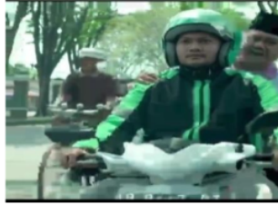
Gambar 6. Caleg dibonceng oleh ojek online dan didahului oleh sepeda ontel

yang dikayuh seorang lelaki tua mampu mendahului sepeda motor tersebut. Adegan tersebut ada dalam video berjudul 'Banyak Caleg Habis Dipilih Kerjanya Malas-Malasan'.