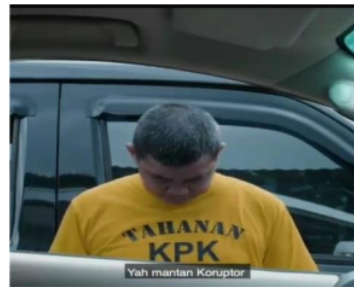
Gambar 2. Ketika kaca jendela dibuka ternyata yang muncul adalah lelaki yang sama dengan pakaian tahanan KPK yang artinya seorang koruptor

Gambar di atas merupakan adegan video berjudul “Tampang Caleg” yang berdurasi 20 detik. Gambar pada scene 1 menunjukkan seorang calon legislatif tersenyum sambil berkaca di samping mobil. Calon legislatif tersebut menggunakan jas dan dasi yang menyimbolkan kaum kaya, pebisnis dan berkelas, lalu peci yang memberi symbol ke-Indonesia-an yang digagas oleh Soekarno (Nordholt, 2005:102) dan pin di dada kiri menunjukkan identitas dirinya sebagai Calon Anggota Legislatif RI.