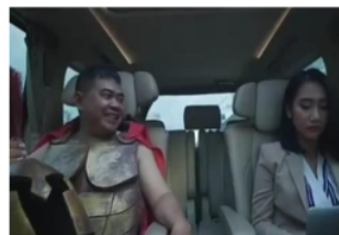
Gambar 10. Caleg saat berubah menjadi gladiator untuk menarik dukungan

Perubahan yang terjadi pada video di atas adalah sebuah lelucon yang digunakan oleh TemanRayat.Id untuk menggambarkan proses pencitraan yang digunakan Caleg dalam setiap aksi politiknya. Video tersebut merupakan signifier yang menandakan pada perilaku Caleg sebagaimana yang dipahami oleh pembuat video sebagai representasi masyarakat luas. Pencitraan sendiri sebenarnya bukan bermakna jelek, tetapi karena digunakan untuk ‘memberi wajah baru’ para Caleg akhirnya dianggap negatif.