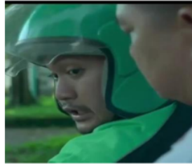
Gambar 7. Driver Ojek online berbalik memarahi Caleg karena minta cepat