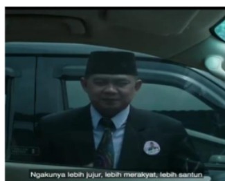
Gambar 5. Caleg yang berpakaian rapi berdiri di luar jendela sebuah mobil

masyarakat. Sehingga sangat dikhawatirkan akan terjadi kasus yang sama ketika dia masih menjadi anggota dewan.