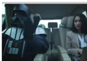
Gambar 9. Caleg saat berubah menjadi dark vader untuk menarik dukungan