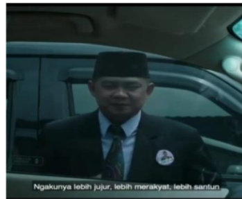
Gambar 1. Caleg ketika dilihat dari jendela di dalam sebuah mobil berpakaian jas, berdasi, dan berkopiah.

Salah satu sifat yang sering dinisbatkan kepada anggota dewan adalah pembohong. Survei Indonesia Network Elections Survey (INES) yang dikutip oleh Novi (2013) dalam Republika, bahwa 89.3 persen masyarakat menganggap anggota DPR pembohong. Hal ini juga tampak pada tiga judul video dari tujuh video yang telah dianalisis. Tiga video ini berjudul : ‘Tampang Caleg’, ‘Jangan Gampang Percaya Janji-janji Caleg’ dan ‘Azab Caleg Suka Umbar Janji’.