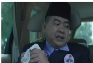
Gambar 8. Caleg saat bertanya agenda kampanye kepada asistennya

Caleg dalam video kali ini mempraktekkan proses pencitraan dengan memakai berbagai jenis kostum untuk terlihat membaur dengan masyarakat. Ketika diberi tahu oleh asistennya bahwa Caleg akan kampanye di ‘Kampung Jawara’, Caleg langsung berfikir harus menjadi orang lain yang dapat memikat pemilih. Ia berubah dari dasi, jas dan kemeja, ke dark vader salah satu superhero di film Star Wars, lalu berubah menjadi sosok panglima perang zaman Yunani sebagaimana film 300 .